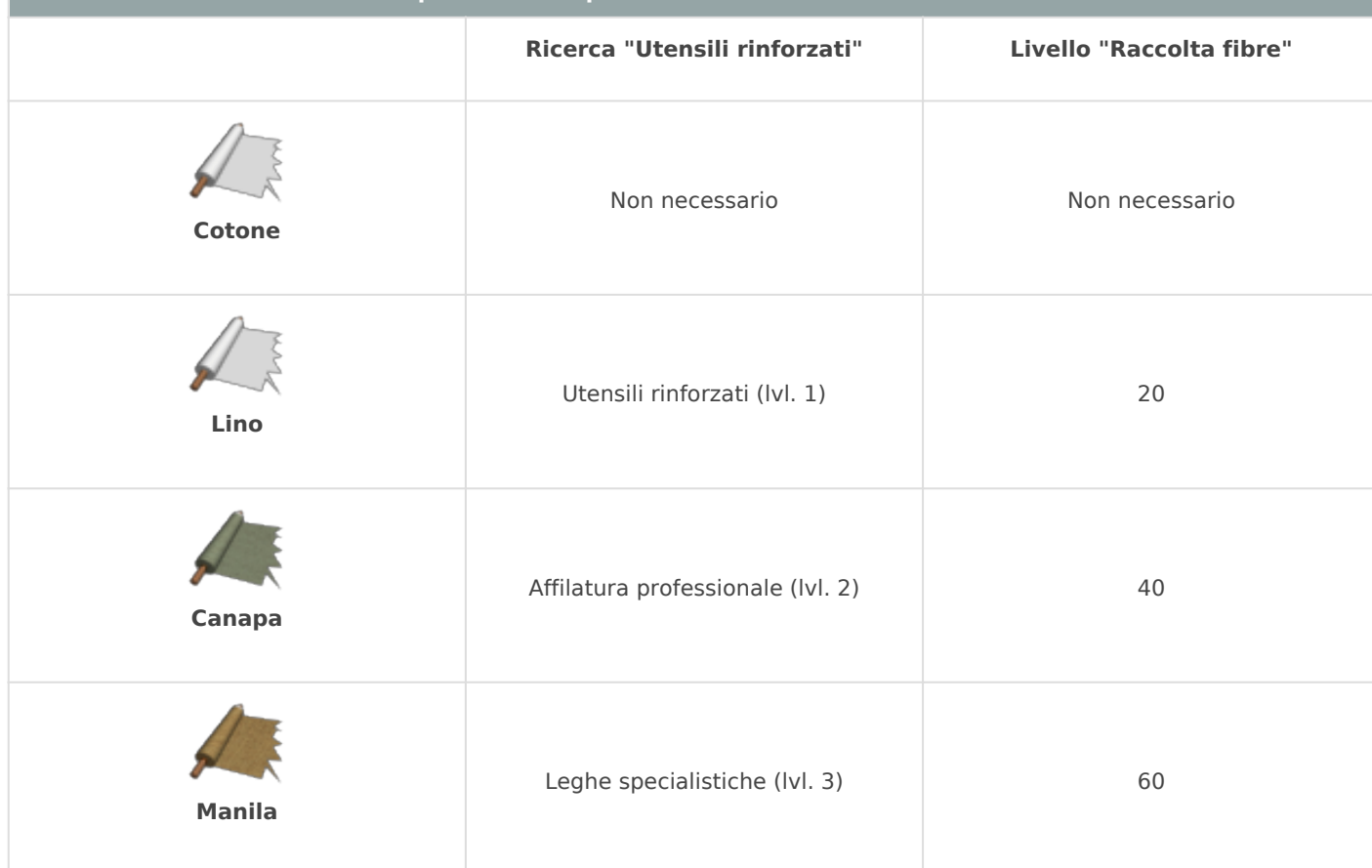
Requisiti minimi per estrazione delle diverse stoffe

Maggiore la qualità della stoffa impiegata e migliore la qualità degli item derivati (ovvero le Vele). Va da sé che saranno anche maggiori i requisiti per trovarle .